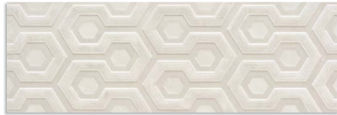
BtK713 Axis 30x90 Ceniza