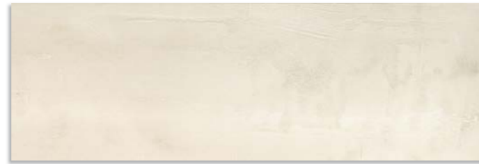
BxD670 Cast 30x90 Marfil