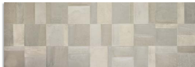
BwT990 Mosaico Cast 30x90 Iris