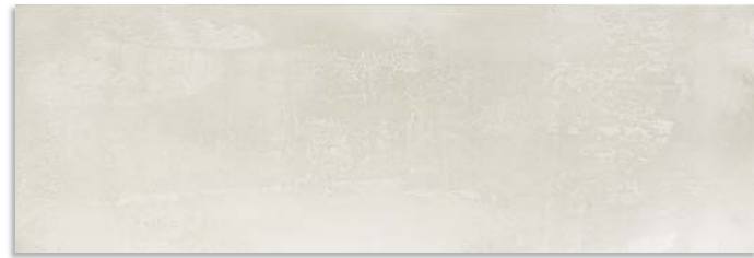
BxD713 Cast 30x90 Ceniza