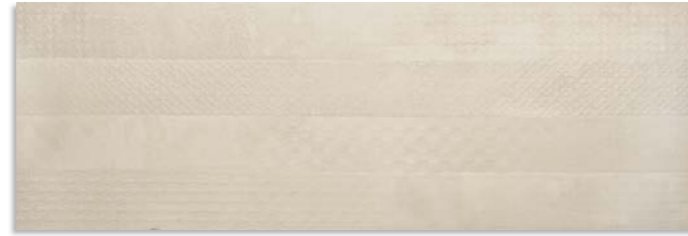
BwX620 Fuse 30x90 Crema