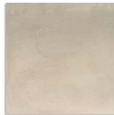
Byp620 Cast 60x60 Crema