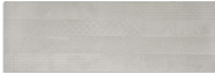
BwX710 Fuse 30x90 Gris