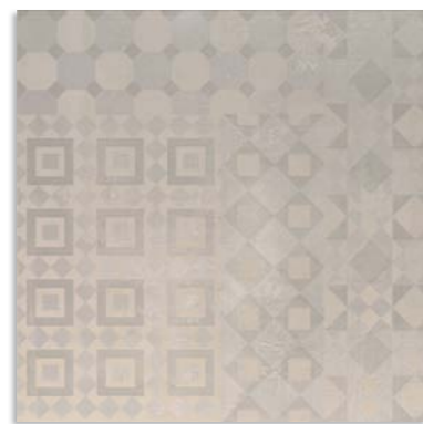
Bvm990 Melt 60x60 Iris