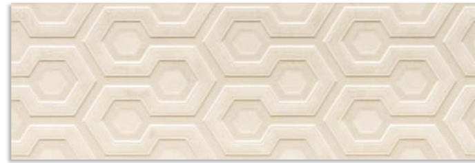
BtK670 Axis 30x90 Marfil