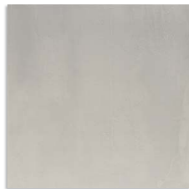
Byp710 Cast 60x60 Gris